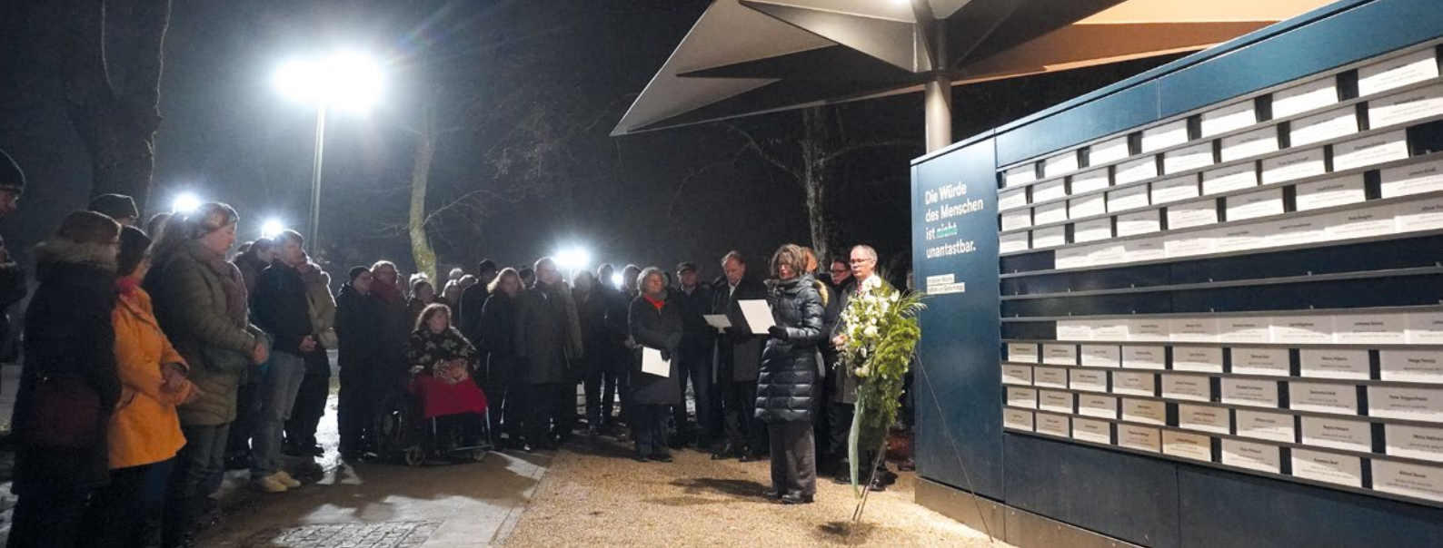
Erinnern an die rund 4000 Opfer der „T4-Aktion“ Bayern an der „Bibliothek der Namen“ am Tag des Gedenkens der Opfer des Nationalsozialismus.