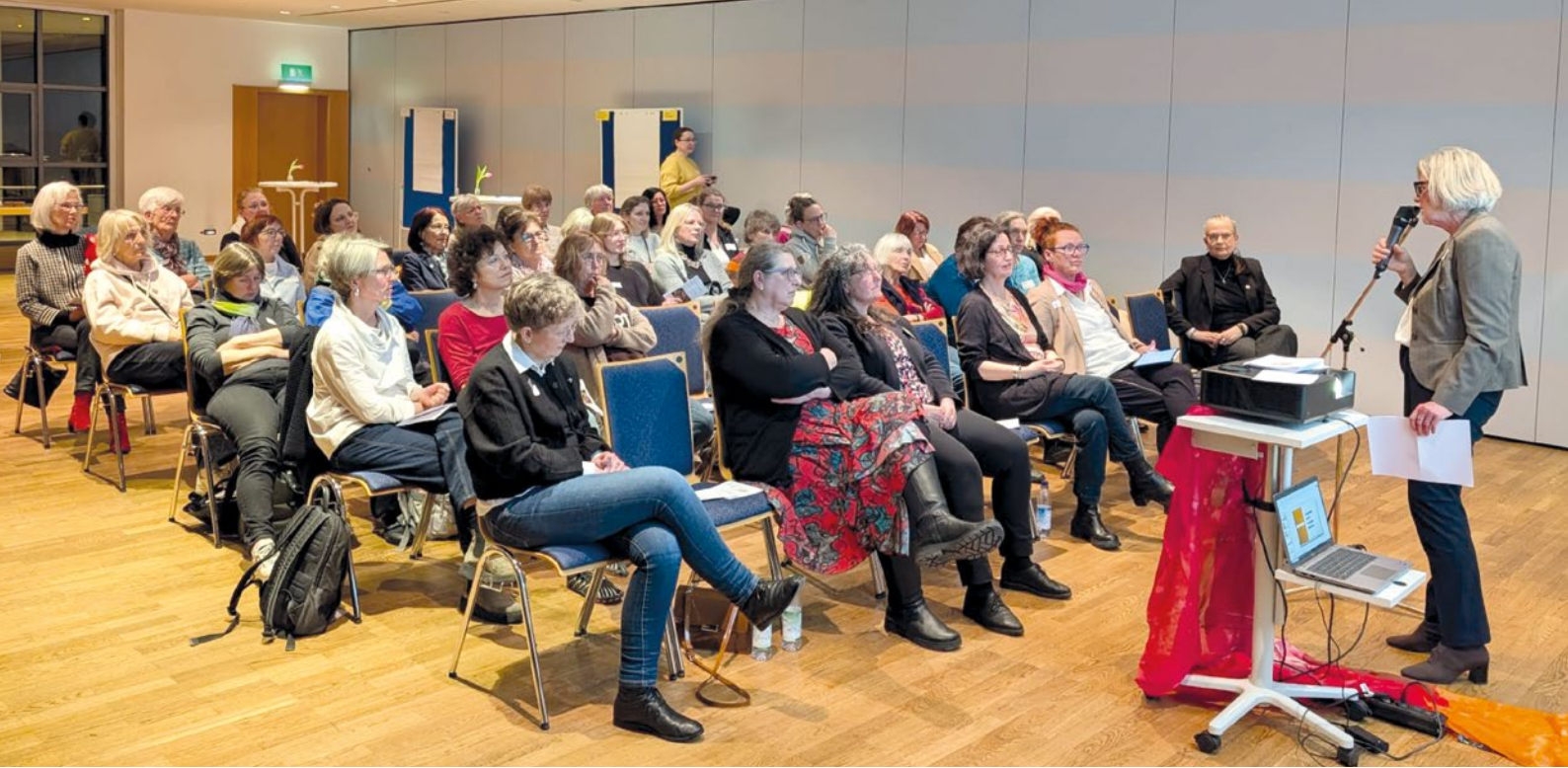
Mit großem Interesse verfolgen im kleinen Bürgersaal Frauen das erste Frauenforum.