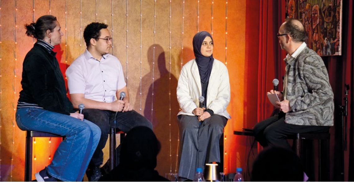
Gesprächsrunde im Kleinen Theater Haar anlässlich der Internationalen Wochen gegen Rassismus.