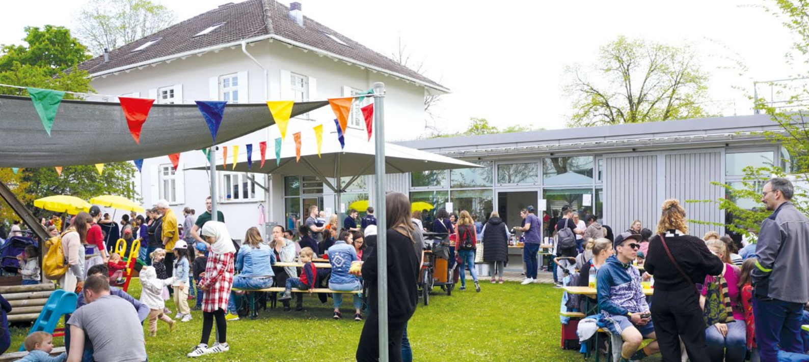
Das FAM (Archivbild), Anlaufstelle für Haarer Familien, freut sich über neue Paten, die Familien im Alltag begleiten wollen.