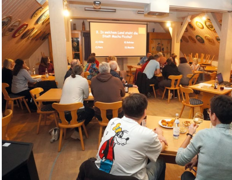
Ein Abend ohne Smartphone: Pub-Quizzen kommt bei den Mitgliedern der BVO gut an.

ca via Laptop auf einen großen Bildschirm wirft, nur 30 Sekunden lang. Zählen Chopin, Schumann und Mendelssohn nun zu den Komponisten der Wiener Romantik oder nicht? Welche Filmreihe handelt von einem jungen Zauberer mit einer Narbe auf der Stirn? Was gilt in Otendichl als „glücklich machend“? Es geht um Wissen, das von der Tragkraft der Flügel einer Ameise, der Hauptstadt von Turkmenistan bis hin zur Chartplatzierung eines One-Hit-Wonders in Deutschland aus den 1980ern handeln kann. Zu jeder Frage gibt es im Multiple-Choice-Verfahren mehr oder weniger eindeutige Antwortvorgaben. Von den Teammitgliedern fordert das in Zeiten der Omnipräsenz digitaler Medien eine oft vergessene Fähigkeit: Kommunikation und die in 2.0-Version, was nichts anderes bedeutet als einen höheren Gang in Sachen Sprechgeschwindigkeit einlegen zu müssen. Hilfreich an mancher Stelle sind legale Dopingmittel wie ein Spezi, Glaserl Wein oder eine gekühlte Halbe.