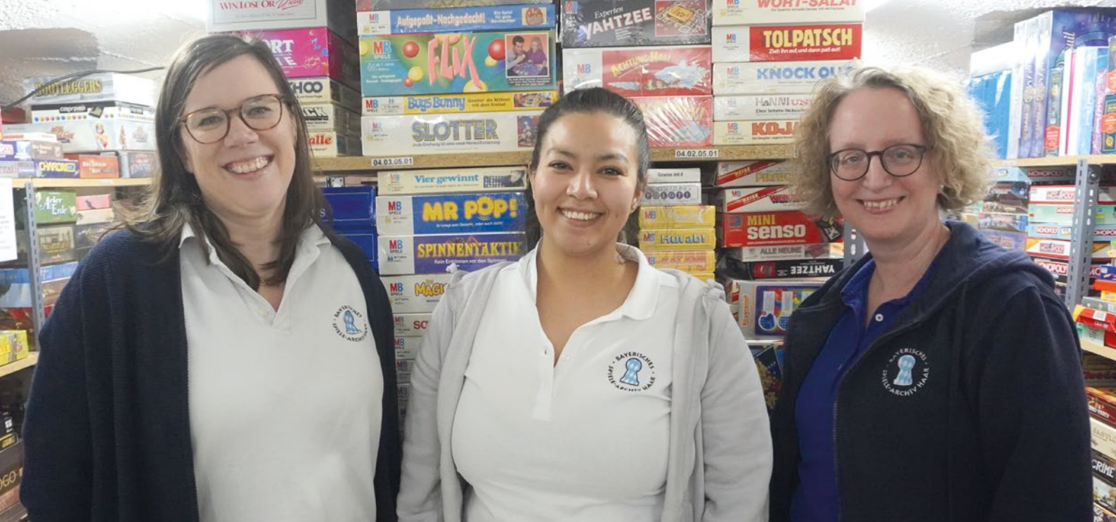
Raus aus der Unsichtbarkeit: Spielearchiv widmet Bundestag der Archive am Internationalen Frauentag den Frauen.